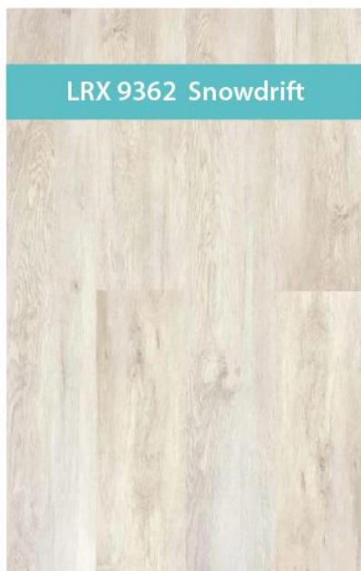
LRX 9362 Snowdrift